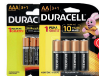
Pilha Alcalina Duracell AA ou AAA Cartela