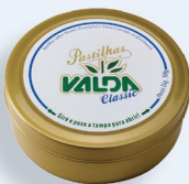
Pastilhas Valda Classic Lata 50g