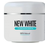
Clareador Dental New White 11g