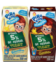
Bebida Láctea Pirakids School 200ml (Baunilha, Chocolate)