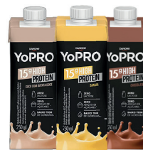
YoPRO Bebida Láctea Danone High Protein 250ml Banana, Chocolate ou Coco com Batata Doce