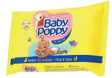
Toalha Umedecida Baby Poppy c/100 Unidades