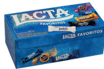
Chocolate Lacta 250g