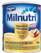
Composto Lácteo Milnutri Vitaminas de Frutas 380g