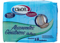
Absorvente ClinOff com 18 unidades