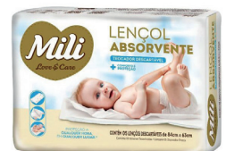
Lençol Absorvente Descartável Mili c/5