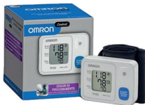
Aparelho Medidor de Pressão Arterial Pulso Control 6124