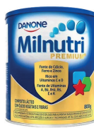
Composto Lácteo Milnutri Premium 800g