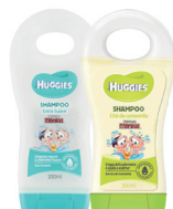
Shampoo Infantil Huggies 200ml