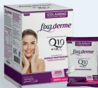
Colágeno Fixa Derme 15 sachês