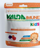
Gomas Mastigáveis Valda Imune Kids c/30