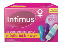
Absorvente Íntimus Interno c/8