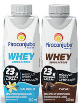
Whey Piracanjuba Zero Lactose 250ml (Cacau e Baunilha)