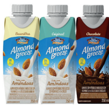
Bebida Almond Breeze com Amêndoas 250ml Original, Chocolate ou Baunilha