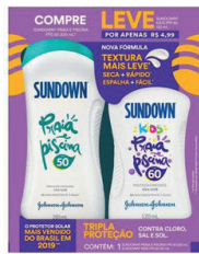
Sundown FPS 50 200ml + Kids FPS60 120ml