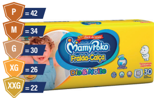
Fralda Mamypoko Calça Mega D&N