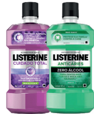
Listerine 500ml Anticaries ou Cuidado Total