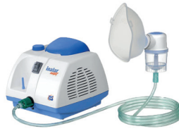
Aparelho de Inalação Inalar Compact (OMROM)