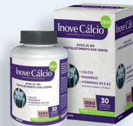
Inove Cálcio com 30 comprimidos mastigáveis