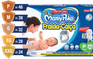
Fralda-Calça Mamypoko Mega Azul