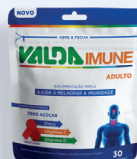
Gomas Mastigáveis Valda Imune Adulto c/30