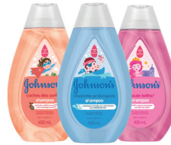
Shampoo Infantil Johnsons Baby 400ml