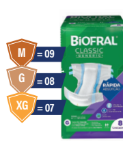
Fralda Biofral Geriátrica Classic