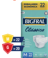
Fralda Bigfral Noturna Clássica G 20 ou M 22