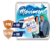
Roupa Íntima Moviment