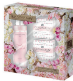
Kit Giovanna Baby Rosa Body Splash + 2 Sabonetes 90g