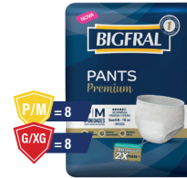
Roupa Íntima Bigfral Premium Pants