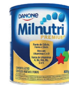
Milnutri Premium 800g