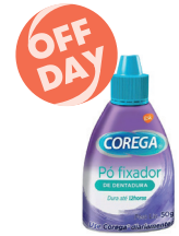
Fixador Corega P6 50g