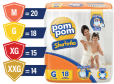
Fralda Pompom Shortinho Jumbinho