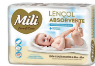
Lençol Absorvente Descartável Mili c/5 Unidades