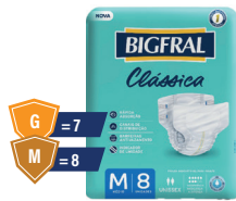
Fralda Bigfral Clássica G 7 ou M 8