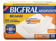
Absorvente Bigfral Bigmaxi c/20 unidades