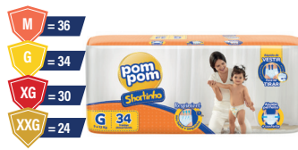
Fralda Pompom Shortinho Jumbo