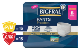
Roupa Íntima Bigfral Premium Pants