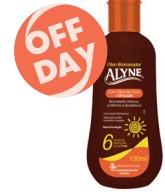
Bronzeador Alyne FPS 6 Óleo de Coco e Urucum 100ml