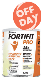
Fortifit Pro 470g Baunilha ou Vitamina