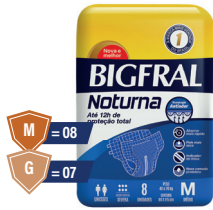
Fralda Bigfral Noturna