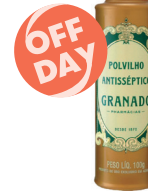
Talco Granado 100g