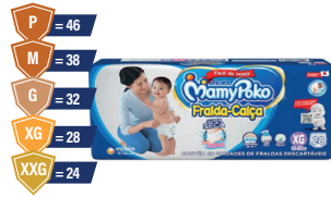
Fralda-Calça MamyPoko Mega Azul