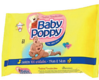
Toalha Umedecida Baby Poppy c/100 Unidades