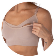
Sutiã Trifil Af Amamentação

*Ofertas válidas somente para mesmo tamanho.