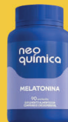
Melatonina c/90 Cápsulas (Neo Química)