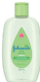
Colônia Infantil J&J Baby 200ml Lavanda