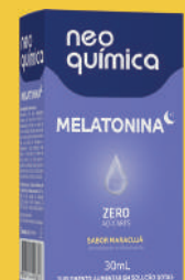
Melatonina Maracujá 30ml Gotas