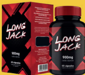
Long Jack 900mg c/60 Cápsulas