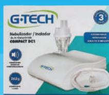
Aparelho Nebulizador/ Inalador G-Tech