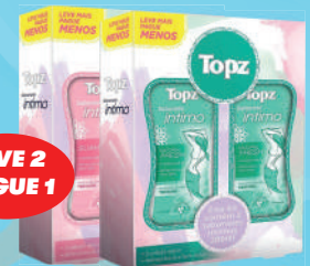
Sabonete Líquido Íntimo Cremer Topz 200ml