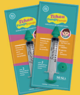
Seringa p/Lavagem Nasal Funga-Funga