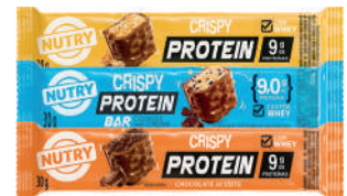
Barra de Proteína Nutry Crispy 30g