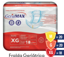
Fralda Geriátrica Gerimax Mega