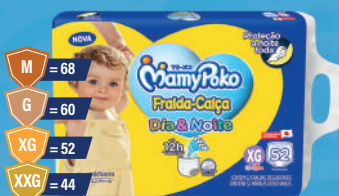
Fralda MamyPoko Dia & Noite Giga