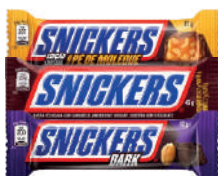
Chocolate Snickers 45g ou 42g

O MINISTÉRIO DA SAÚDE INFORMA: O ALEITAMENTO MATERNO EVITA INFECÇÕES E ALERGIAS E É RECOMENDADO ATÉ OS 2(DOIS) ANOS DE IDADE OU MAIS.