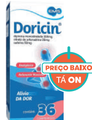
Doricin c/36 Comprimidos