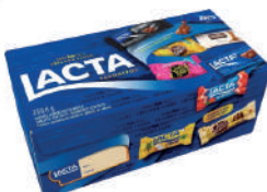
Chocolate Lacta 250g Favoritos