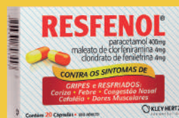
Resfenol c/20 Cápsulas