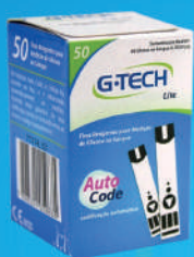
Tiras Reagentes Lite c/50 Unidades