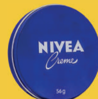
Creme Nivea 56g