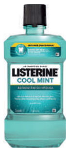
Listerine 1L Cool Mint