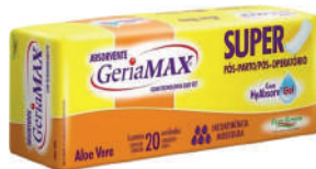
Absorvente P6s-parto Gerimax c/20 Unidades