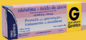
Nistatina + Óxido de Zinco Pomada 60g