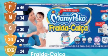
Fralda-Calça MamyPoko Jumbo Azul