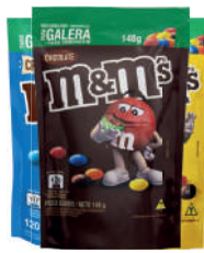
Chocolate M&M 148g