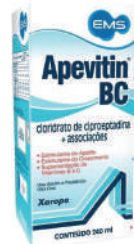
Apevitin BC 240ml