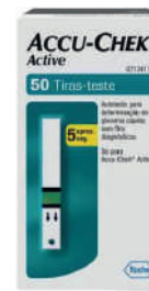
Tira Glicose Accu- Check Active c/50 Unidades