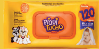
Toalhinha Umedecidas Piquituchô Premium c/120 Unidades