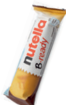
Nutella B-Ready 22g