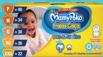
Fralda-Calça MamyPoko Dia & Noite