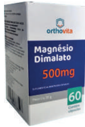
Magnésio Dimalato 500mg Orthovita c/60 Cápsulas