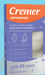
Curativo Cremer Hidrocoloide Cravos e espinhas c/24 Unidades