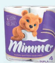
Papel Higiénico Mimmo 30m c/4 Rolos