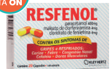
Resfenol c/20 Cápsulas