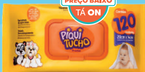
Toalhinha Umedecidas Piquituchô Premium c/120 Unidades