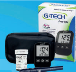
Kit Medidor de Glicose + 10 Tiras Lite