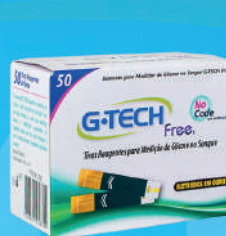
Tiras Reagentes c/50 Unidades