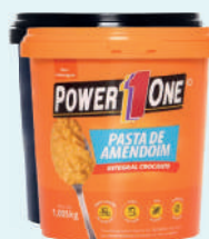
Pasta de Amendoim Power1One 1kg