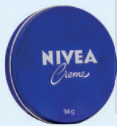
Creme Nivea 56g