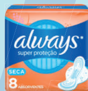
Absorvente Always Básico Seca c/08 Unidades c/Abas