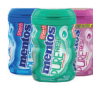
Mentos Pure Fresh Garrafa 92g