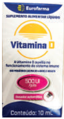
Vitamina D 500UI 10ml