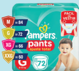
Fralda Pampers Pants Giga Ajuste Total