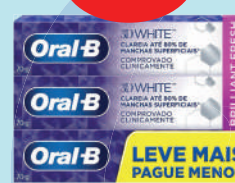
Kit Creme Dental Oral-B 70g