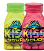
Mentos Kiss Sour 38,5g