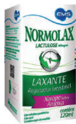
Normolax Líquido 120ml