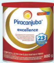
Piracanjuba Excellence Composto Látceo 800g