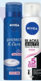
Desodorante Aerosol Nivea 150ml