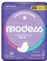
Absorvente Modess c/32 Unidades c/Abas Suave