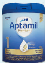
Aptamil 1 Premium Lata 800g