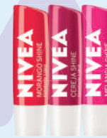
Protetor Labial Nivea 4,8g