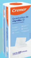
Algodão Quadrado Cremer c/100 Unidades