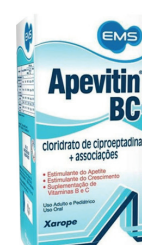
Apevitin BC 240ml