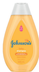
Shampoo Infantil J&J Baby 400ml