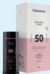
Base Stick Hidrabene FPS50 120g (Clara e Média)