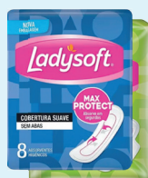
Absorvente Ladysoft Suave c/08 Unidades c/Abas ou s/Abas