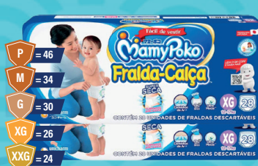
Fralda-Calça MamyPoko Jumbo Azul