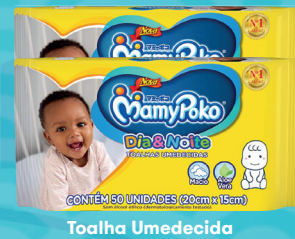
Toalha Umedecida MamyPoko Dia & Noite c/50 Unidades