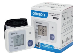
Medidor de Pressão de Pulso Omron 6181

MS.: 1.5721.1214.012-7 de R$ 21,62 por 18,99 , cada