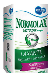
Normolax Líquido 120ml