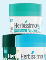
Creme Desodorante Herbissimo 55g