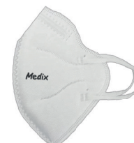
Máscara de Proteção Facial PFF2 ou N95

MS.: 1.0497.1451.001-5 de R$ 18,58 por 13,99 , cada