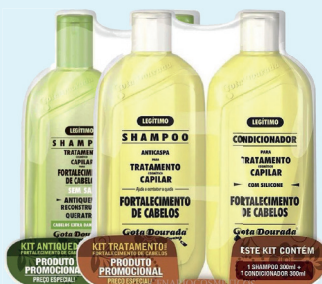
Kit Shampoo + Condicionador Gota Dourada 300ml