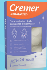
Curativo Cremer Hidrocoloide p/ Acnes e Espinhas c/24 Unidades