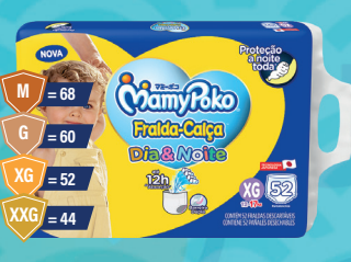
Fralda MamyPoko Dia & Noite Giga