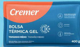
Bolsa Gel Térmica 400g Cremer