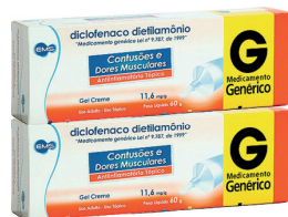
Gel Creme Diclofenaco Dietilamônio Genérico 60g