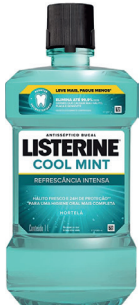
Listerine 1L Cool Mint