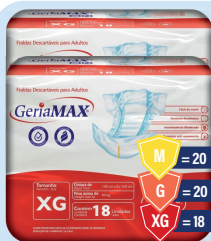
Fralda Geriátrica Gerimax Mega