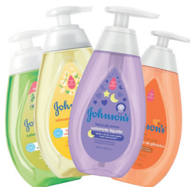
Sabonete Líquido Infantil J&J 400ml