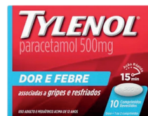
Tylenol 500mg Dor e Febre c/10 Comprimidos

MS.: 1.5721.1214.012-7 de R$ 21,62 por 18,99 , cada