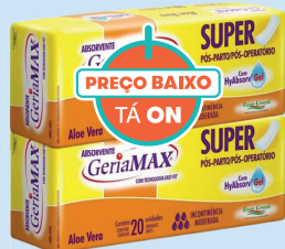
Absorvente Pós-parto Gerimax c/20 Unidades