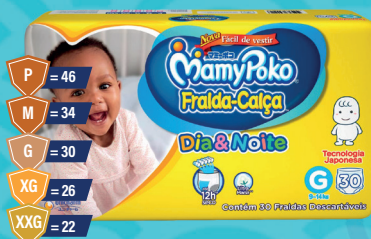
Fralda-Calça MamyPoko Dia & Noite