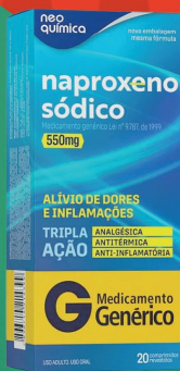
naproxeno sódico 550mg

ALÍVIO DE DORES E INFLAMAÇÕES TRIPLA AÇÃO