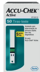
Tira Glicose Accu-Check Active c/50 Unidades