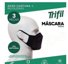
Máscara Proteção Facial Trifil c/03 Unidades Branca ou Preta