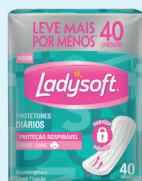
Absorvente Ladysoft Protetor Diário c/40 Unidades