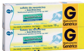
Pomada Neomicina+ Bacitracina Genérica 15g