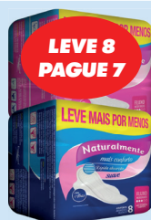
Absorvente Naturalmente Gel