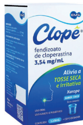
Clope Xarope 120ml