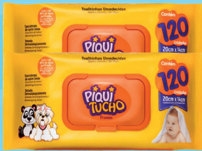
Toalhinha Umedecidas Piqui Toalhinha Umedecidas Premium c/120 Unidades