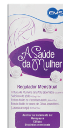
A Saúde da Mulher 150ml