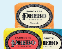
Sabonete Barra Phebo 90g