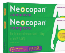
Neocopan c/20 Comprimidos

MS.: 1.0497.1451.001-5 de R$ 18,58 por 13,99 , cada