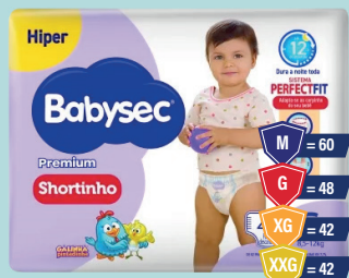
Fralda Babysec Shortinho Hyper