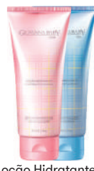
Loção Hidratante Giovanna Baby 200ml