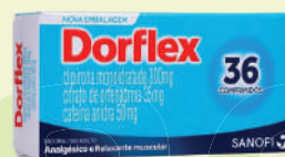
Dorflex c/36 Comprimidos