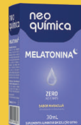
Melatonina Maracujá 30ml Gotas