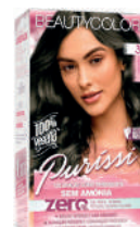
Tinta Beauty Color 3.0 s/Amônia