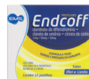
Endcoff Pastilhas c/12 Unidades