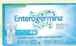
Enterogermina c/10 Frascos