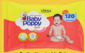
Toalha Umedecida Baby Poppy c/120 Unidades