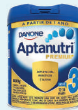
Aptanutri 3 Lata 800g