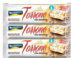
Torrone c/ Amendoim 45g