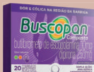
Buscopan Composto c/20 Comprimidos