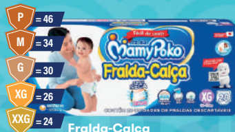
Fralda-Calça MamyPoko Jumbo Azul