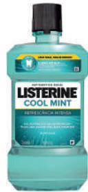
Listerine 1L Cool Mint