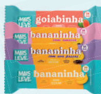
Bananinha Mais Leve 30g