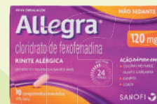
Allegra 120mg c/10 Comprimidos