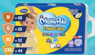
Fralda MamyPoko Dia & Noite Giga