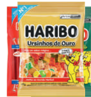
Bala Gel Haribo 80g