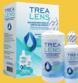
Kit Trealens Solução 360+120ml