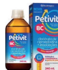
Petivit BC Xarope 240ml