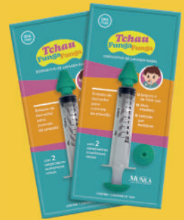
Seringa p/Lavagem Nasal Fungo-Funga