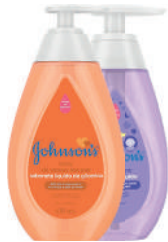
Sabonete Líquido Infantil J&J 400ml