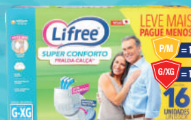
Fralda-Calça Lifree Super Conforto