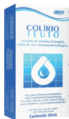
Colírio Teuto 20ml