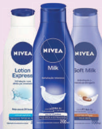
Hidratante Nivea 200ml