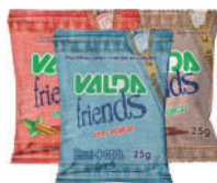
Sachê Pastilhas Valda Friends 25g