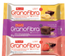
Barra de Cereal Granofibra 20g