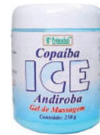
Ice Copaíba Andiroba 250g