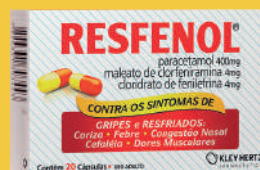
Resfenol c/20 Cápsulas