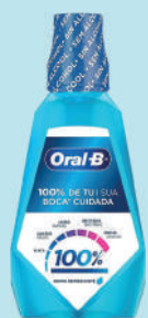
Solução Bucal Oral-B 100% Menta s/Álcool 1L