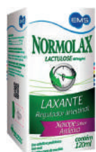
Normolax Líquido 120ml