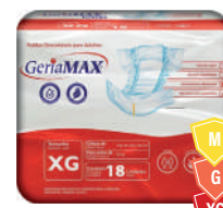
Fralda Geriátrica Gerimax Mega