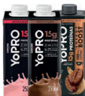
YoPRO Bebida Lactea UHT 250ml