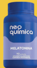
Melatonina c/90 Cápsulas (Neo Química)