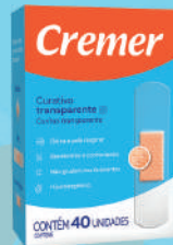
Curativo Cremer Transparente c/40 Unidades