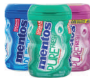
Mentos Pure Fresh Garrafa 92g