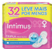
Absorvente Intimus Gel Tripla Proteção c/32 Unidades