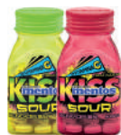
Mentos Kiss Sour 38,5g