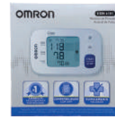
Medidor de Pressão de Pulso Omron 6181