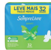
Absorvente Sempre Livre Especial c/32 Unidades c/Abas Suave