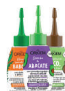
Reparador Origem 30ml