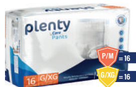
Fralda Roupa Íntima Plenty Care