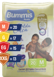
Fralda Bummi's Pants Jumbinho