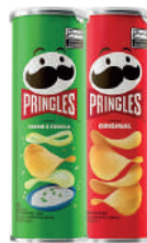
Batata Pringles 104g