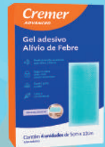
Gel Adesivo Alívio de Febre c/04 Unidades