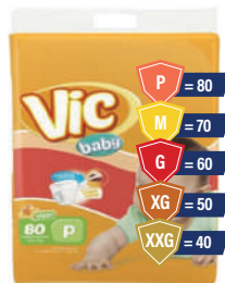
Fralda Vic Baby Hiper