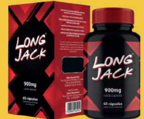
Long Jack 900mg c/60 Cápsulas