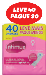
Protetor Intimus c/40 Unidades