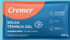
Bolsa Gel Cremer 400g Térmica