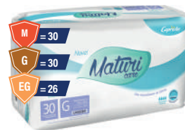
Fralda Geriátrica Maturi Care Econômica