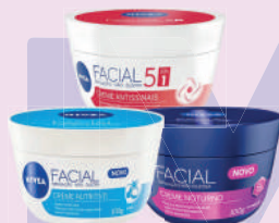
Creme Facial Nivea 100g