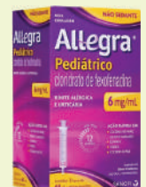
Allegra Pediátrico 6mg 60ml