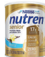
Nutren Senior Nestlé 740g