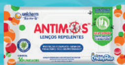
Lenços Repelentes Antimos c/16 Unidades