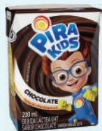
Pirakids Lactea UHT 200ml Chocolate