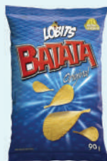
Batata Lobits 40g