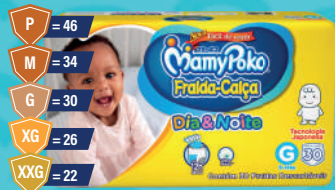
Fralda-Calça MamyPoko Dia & Noite