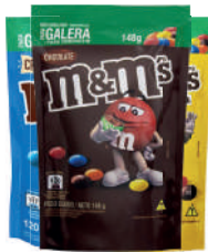
Chocolate M&M 148g