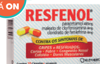
Resfenol c/20 Cápsulas