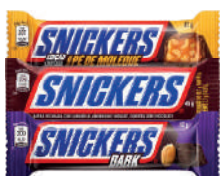
Chocolate Snickers 45g ou 42g

O MINISTÉRIO DA SAÚDE INFORMA: O ALEITAMENTO MATERNO EVITA INFECÇÕES E ALERGIAS E É RECOMENDADO ATÉ OS 2(DOIS) ANOS DE IDADE OU MAIS.