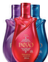
Óleo Paixão 200ml