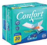
Absorvente Multiuso Confort Master c/20 Unidades