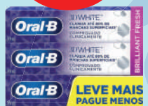
Kit Creme Dental Oral-B 70g