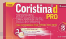
Coristina D Pro c/08 Comprimidos