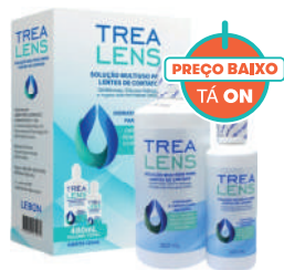
Kit Treatens Solução 360+120ml