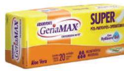
Absorvente Pós-parto Gerimax c/20 Unidades