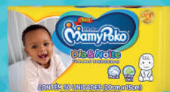
Toalha Umedecida MamyPoko Dia & Noite c/50 Unidades