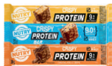
Barra de Proteína Nutry Crispy 30g