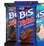
Chocolate Bis Xtra 45g