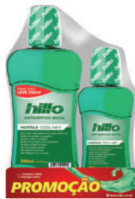
Antisséptico Bucal Hillo 500+250ml (Diversos Sabores)