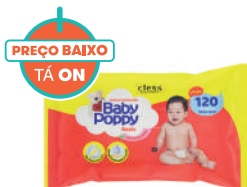
Toalha Umedecida Baby Poppy c/120 Unidades