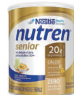
Nutren Senior Nestlé 370g