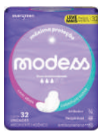
Absorvente Modess c/32 Unidades c/Abas Suave