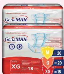
Fralda Geriátrica Gerimax Mega