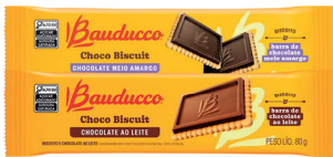
Choco Biscuit Bauducco 80g