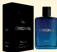
Deo Colônia Men 100ml Piment Original