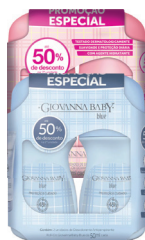
Desodorante Rollon Giovanna Baby 50ml Kit c/02 Unidades