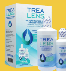
Kit Trealens Solução 360+120ml