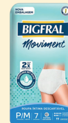
Roupa Íntima Moviment