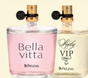
Deo Colônia Petúnia 100ml