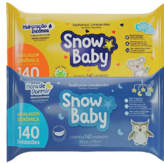
Toalha Umedecida Snowbaby c/140 Unidades