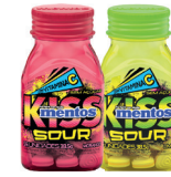
Mentos 38,5g c/55 Kiss Sour