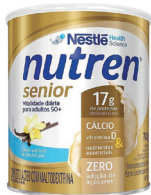
Nutren Senior Nestlé 740g