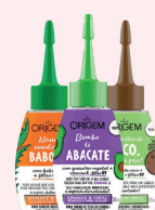
Reparador Origem 30ml