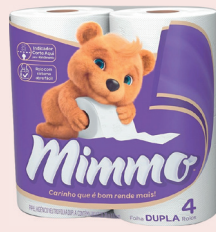
Papel Higiênico Mimmo 30m c/04 Rolos