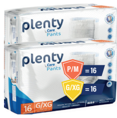
Fralda Roupã Íntima Plenty Care