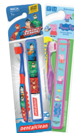
Escova Dental Clean Infantil Macia