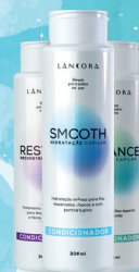
Condicionador Lâncora 300ml