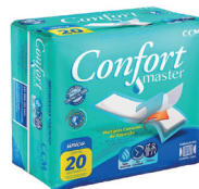
Absorvente Multiuso Confort Master c/20 Unidades