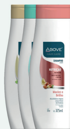
Shampoo Above 325ml