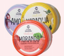
Esfoliante Corpo Dourado 150g