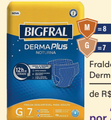
Fralda Bigfral Derma Plus Noturna