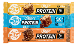
Barra de Proteína Nutry Crispy 30g