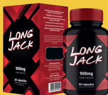
Long Jack 900mg c/60 Cápsulas