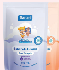
Sabonete Líquido Turma da Xuxinha Refil 210ml