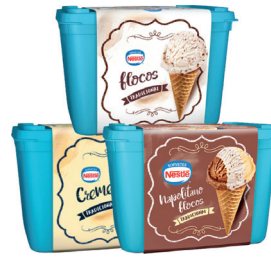
Sorvete Nestlé Pote 1,5L Tradicional