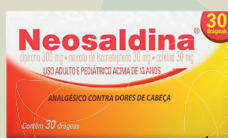
Neosaldina c/30 Comprimidos