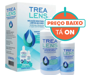
Kit Trealens Solução 360+120ml