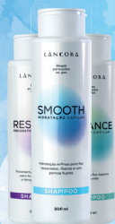
Shampoo Lâncora 300ml