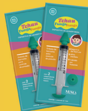
Seringa p/Lavagem Nasal Funga-Funga