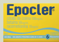
Epocler c/06 Flaconetes 10ml