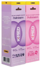
K-Med Preliminares 50g