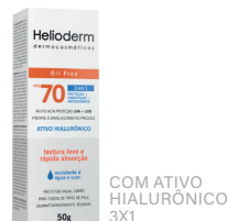
Protetor Solar Helioderm FPS70 Facial 50g