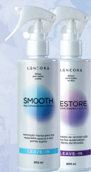
Leave-In Lâncora 200ml