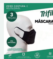
Máscara Proteção Facial Trifil c/03 Unidades Branca ou Preta