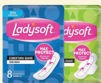
Absorvente Ladysoft Suave c/08 Unidades c/Abas ou s/Abas