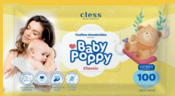
Toalha Umedecida Baby Poppy c/100 Unidades

DE 1 A 07 DE OUTUBRO + TODOS OS SÁBADOS, DOMINGOS E FERIADOS NACIONAIS