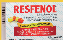
Resfenol c/20 Cápsulas