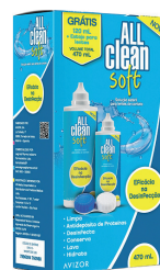
All Clean Soft 6 em 1 470ml

MS: 1.6773.0542.001-3 de R$ 19,67 por 9,99 cada