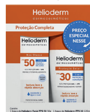
Kit Helioderm FPS30 50g + 50 FPS Facial

PROTEÇÃO + HIDRATAÇÃO NÃO OLEOSO / TOQUE SECO