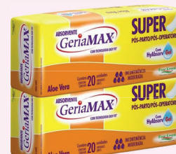
Absorvente Pós-parto Gerimax c/20 Unidades