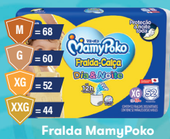
Fralda MamyPoko Dia & Noite Giga