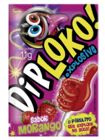
Dip Loko 11g (Diversos Sabores)