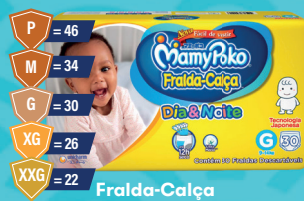
Fralda-Calça MamyPoko Dia & Noite