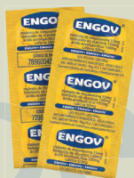
Engov Envelope c/06 Comprimidos