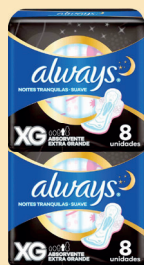
Absorvente Always Noites Tranquilas c/08 Unidades Suave XG c/Abas