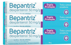
Bepantriz Pomada 30g