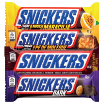
Chocolate Snickers 45g ou 42g