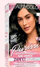
Tinta Beauty Color 3.0 s/Amônia