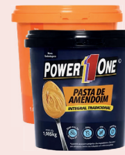
Pasta de Amendoim Power1One 1kg