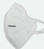
Máscara de Proteção Facial PFF2 ou N95