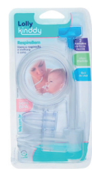
Aspirador Nasal Respirebem