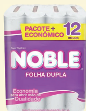
Papel Higiénico Noble c/12 Unidades