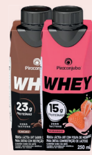
Whey Zero Lactose Morango 250ml