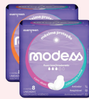
Absorvente Modess c/08 Unidades Suave