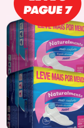
Absorvente Naturalmente Gel