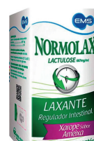
Normolax Líquido 120ml