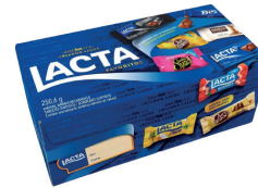
Chocolate Lacta 250g Favoritos