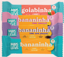
Bananinha Mais Leve 30g