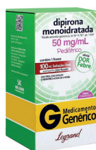
Dipirona Solução * Genérico * 100ml (Legrand)

MS: 1.6773.0542.001-3 de R$ 19,67 por 9,99 cada