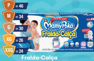
Fralda-Calça MamyPoko Jumbo Azul