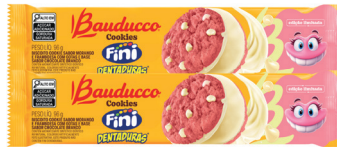
Cookies Bauducco Dentadura 96g