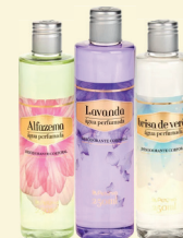
Deo Colônia Petúnia 250ml