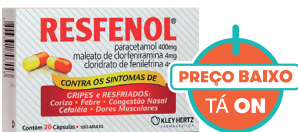
Resfenol c/20 Cápsulas

MULTIPLA AÇÃO VALE POR 5 (CORIZA/FEBRE/DOR DE CABEÇA/CONGESTÃO NASAL/DOR MUSCULAR)