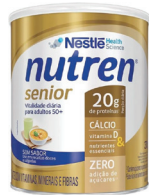
Nutren Senior Nestlé 370g