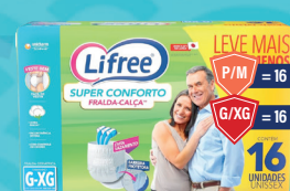
Fralda-Calça Liffree Super Conforto