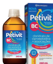
Petivit BC Xarope 240ml