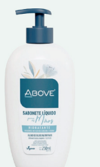
Sabonete Líquido Above p/Mãos 250ml