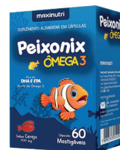
Peixonix Ômega 3 Cereja c/60 Cápsulas Mastigáveis