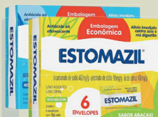
Estomazil P6 5g c/06 Envelopes