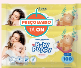
Toalha Umedecida Baby Poppy c/100 Unidades