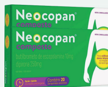
Neocopan c/20 Comprimidos