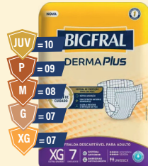
Fralda Bigfral Derma Plus