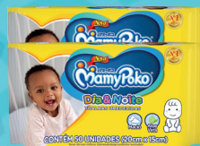
Toalha Umedecida MamyPoko Dia & Noite c/50 Unidades