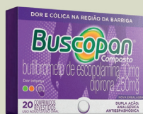
Buscopan Composto c/20 Comprimidos