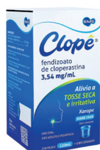
Clope Xarope 120ml