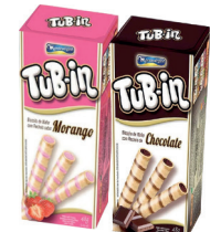
Tub-In Recheio 48g