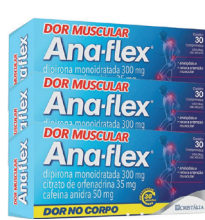
Ana-Flex c/30 Comprimidos