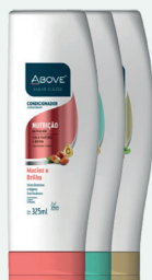
Condicionador Above 325ml