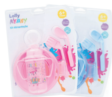
Kit Alimentação Tip Lolly c/04 Peças