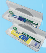
Kit Viagem Hillo c/Gel 60g ou Creme 70g