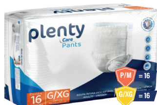
Fralda Roupas Íntimas Plenty Care