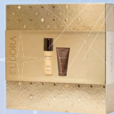
Kit Impression Body Spray 100ml + Pós Barba 75g