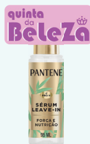
Sérum Leave-In Pantene 95ml