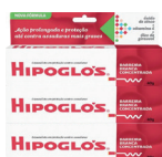
Pomada Hipoglös 40g