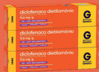
Diclofenaco Dietilamônio Gel 11,6mg c/ 60g