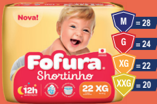
Fralda Fofura Shortinho Mega