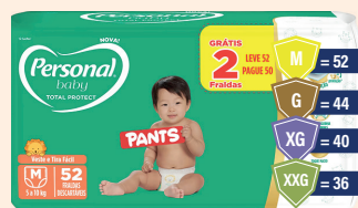
Fralda Personal Protect Hiper