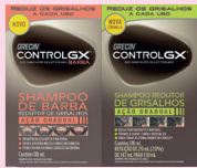
Shampoo Greclin Control GX 118ml Cabelo ou Barba