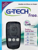
Medidor de Glicose G-Tech Free