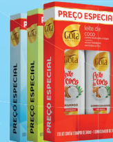
Kit Shampoo + Condicionador Gota Dourada 340ml