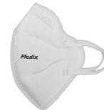
Máscara de Proteção Facial PFF2 ou N95