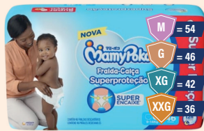
Fralda-Calça MamyPoko Superproteção