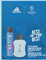
Kit Adidas Best of The Best Perfume Masculino 100ml + Antitranspirante 150ml