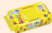
Toalhas Bubby Baby c/100 Unidades