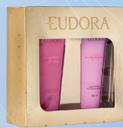
Kit Presenteável Niina Secrets