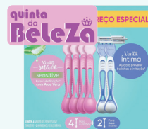
Aparelho de Barbear Gillette Venus c/04 p/ Corpo + 2 p/ Área Íntima