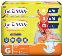
Fralda Geriátrica Geriamax Mega

[Genérico] Pomada Sulfato de Neomicina + Bacitracina 15g é um medicamento. Seu uso pode trazer riscos. Procure um Médico e o Farmacêutico. Leia a bula. Indicação: Tratamento de infecções bacterianas superficiais da pele, como feridas, cortes, queimaduras leves e dermatites infectadas. [Genérico] Desloratadina Xarope 60ml Eurofarma e [Genérico] Cloridrato de Fexofenadina 120mg Eurofarma são medicamentos. Seu uso pode trazer riscos. Procure um Médico e o Farmacêutico. Leia a bula. Indicação: Aliviam os sintomas de rinite e outras reações alérgicas. Neocopan c/20 Comprimidos é um medicamento. Seu uso pode trazer riscos. Procure um Médico e o Farmacêutico. Leia a bula. Princípio Ativo: Butilbrometo de Escopolamina, Dipirona Monoidratada / Indicação: Cólica intensa e espasmos.