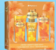
Kit Vanilla Kiss Sabonete Líquido 100ml + Hidratante e Body Splash 200ml