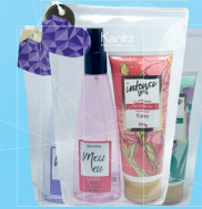
Kit Meu Eu Deocolônia 200ml + Loção Hidratante 200g