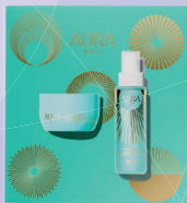
Kit Aura Afrodite Body Splash 60ml + Manteiga Corporal 50g