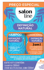
Kit Salon Line Shampoo + Condicionador 300ml