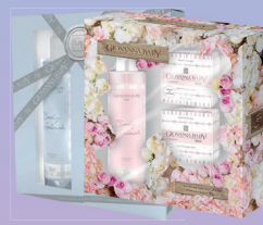
Kit Giovanna Baby Body Splash + 2 Sabonetes