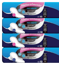
Absorvente Naturalmente Max Noturno c/10 Unidades c/ Ou s/Abas