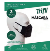
Máscara Proteção Facial Trifil c/03 Unidades Branca ou Preta