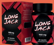
Long Jack 900mg c/ 60 Cápsulas