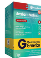
[Genérico] Desloratadina Xarope 60ml Eurofarma