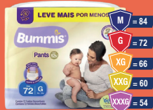
Fralda Bummis Pants