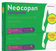
Neocopan c/20 Comprimidos