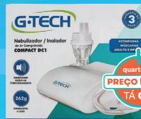
Aparelho Nebulizador/Inalador G-Tech