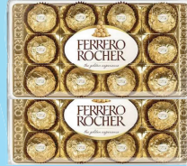
Ferrero Rocher c/12 Unidades 150g