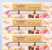
Kit Instance Sabonetes Doces Finos