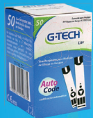
Tiras Reagentes Lite c/50 Unidades