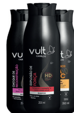
Shampoo Vult 350ml