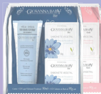
Kit Giovanna Baby Hidratante 50g + 2 Sabonetes