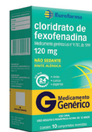
[Genérico] Cloridrato de Fexofenadina 120mg Eurofarma