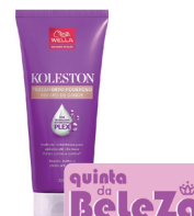
Creme de Tratamento Koleston 170ml