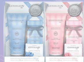
Kit Giovanna Baby Necessaire Colônia 20ml + Loção 200ml + Sabonete 90g