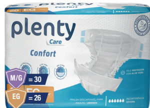
Fralda Plenty Care Confort ADT