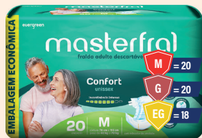
Fralda Masterfral Confort Econômica