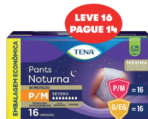
Roupa Íntima Tena Pants Noturna