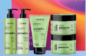
Kit Laborat 5x1 Sabonete + Hidratante + Esfoliante + Sais de Banho (Diversas Fragrâncias)