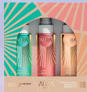
Kit Aura Trilogia das Deusas Body Splash 3x60ml