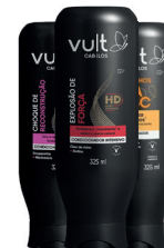
Condicionador Vult 325ml