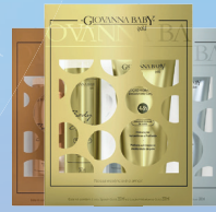
Kit Giovanna Baby Metais Deo Colônia 260ml + Hidratante 200ml