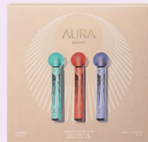
Kit Aura Lollipop Scents Body Splash 3x10ml