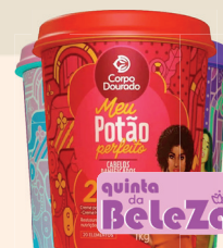
Creme de Tratamento Corpo Dourado Pote 1kg