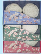
Sabonete Kanitz Flores Estojos c/02 Unidades