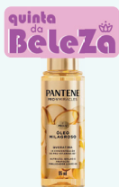
Óleo Milagroso 95ml Queratina Pantene