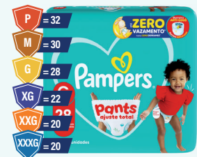
Fralda Pampers Pants Mega Ajuste Total