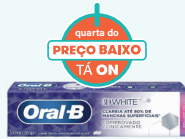
Crema Dental Oral-B White Fresh 70g