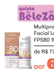
Multiprotetor Facial Labotrat FPS80 15g Stick