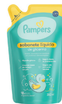
Sabonete Líquido Pampers Glicerina 350ml Refil