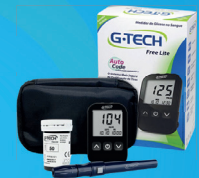
Kit Medidor de Glicose + 10 Tiras Lite