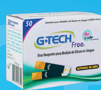
Tiras Reagentes c/50 Unidades