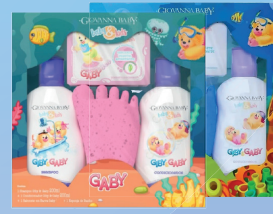
Kit Hora do Banho Shampoo + Condicionador 200ml + Esponja e Sabonete Giby/Gaby