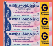
Nistatina + Óxido de Zinco Pomada 60g