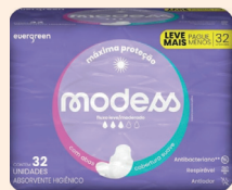
Absorbente Modess Suave c/Abas c/32 Unidades