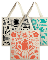
Ecobags Santa Branca